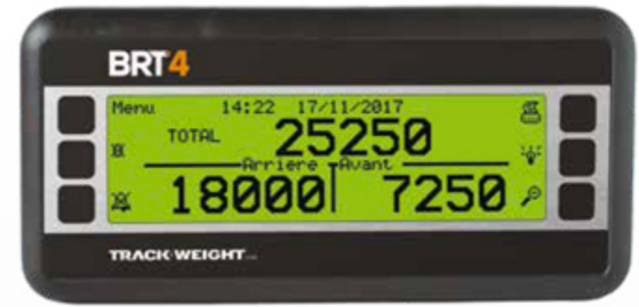
Affichage selon les préférences de l'utilisateur

La pesée s'effectue de manière automatique à l'aide de capteurs installés aux essieux ou encore à la suspension à air des camions. Selon le type de camion, un moniteur mesure en temps réel les flexions de l'acier, affichant le poids total par groupe d'essieux. L'étape pour transformer un camion ou une semi-remorque en balance embarquée est très facile. L'installation peut se faire par vous-même ou par l'un de nos spécialistes et ce, partout au Québec!